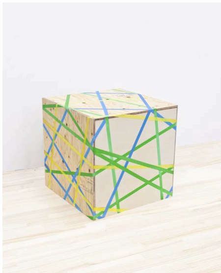
「layer of my labor_40」 2012