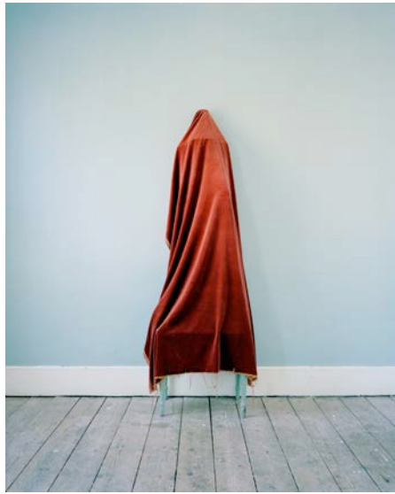
「Obelisk III (You Don't Know What You Are Looking At When You Are Looking At It)」 2013