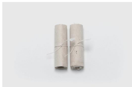
こよみ唄巻物 楮和紙（蛇胴紙、紙漉き：西田誠吉 湧水で擦った炭