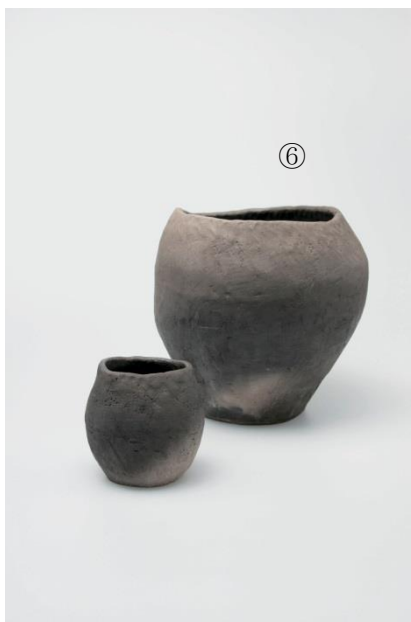
水瓶 水碗 石見の白土、野焼き焼成 石井直人