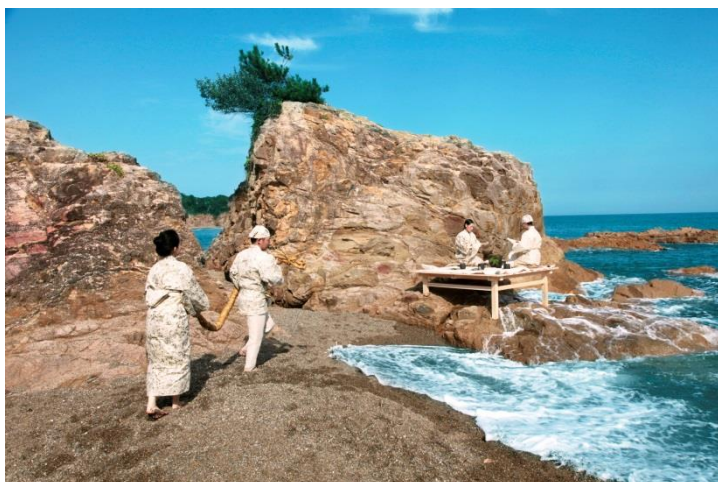
パフォーマンス「お水え」