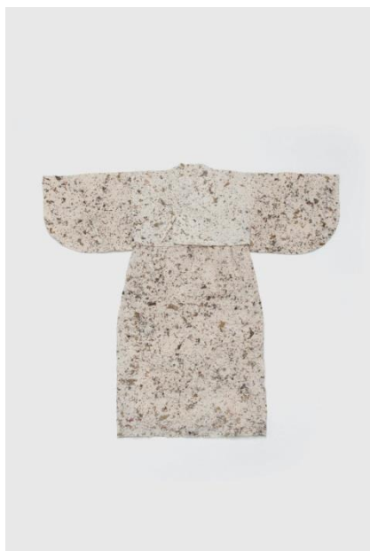
うみかみ紙衣 上衣 下衣 小浜海岸の海藻を漉き込んだ楮和紙 コズミックワンダー