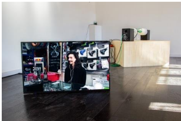
「Compositions」 展示風景 北京人文芸術センター 2017