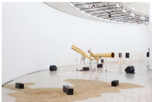
「compositions: space, time and architecture」 展示風景 国際芸術センター青森 2015