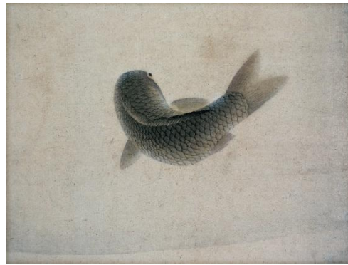
鯉の間 円山応瑞 鯉