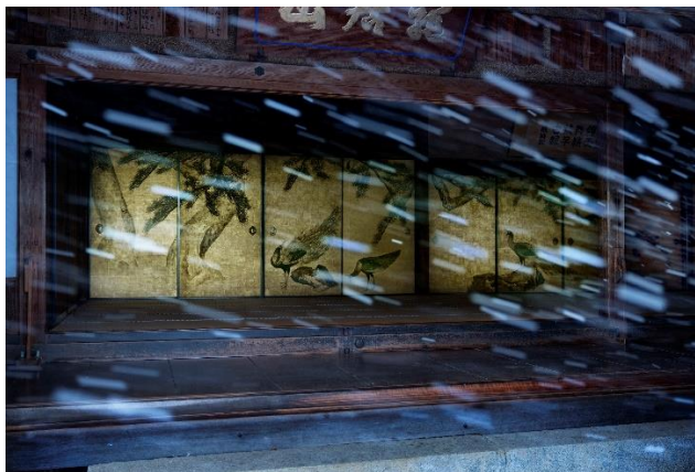
孔雀の間 円山応挙

本展では、十文字が撮り下ろした大乘寺客殿(兵庫県美方郡香美町)の写真を、その特徴ある客殿空間を再構成した大型インスタレーションにより展開します。大乘寺は円山応挙とその一門が描いたとされる襖絵で知られます。十文字の独自のまなざしが生み出す新たな空間は、かつて応挙らがつくり上げた仏教的世界観を包み込みながらも、驚きに満ちた体験をもたらすことでしょう。