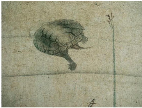
鯉の間 円山応瑞 亀