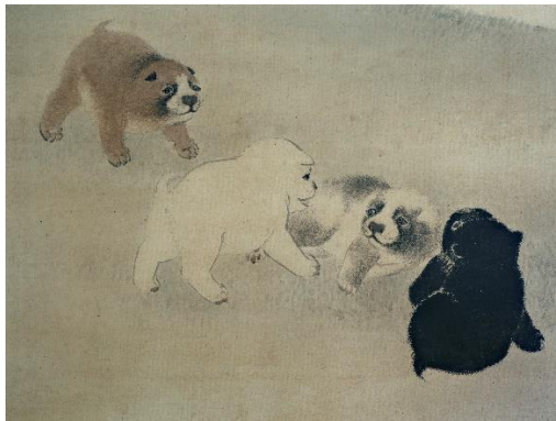
狗子の間 山本守礼 犬