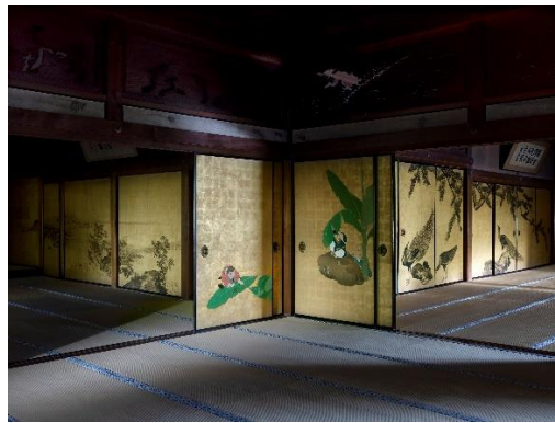
郭子儀の間 円山応挙